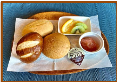
・スィスブレッド 600円 (自家製りんごジャム付)

*スィスブレッドとレアチーズケーキはお飲物と一緒に注文すると セットで50円引きになります。