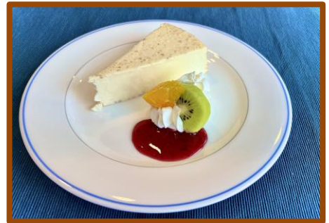
・レアチーズケーキ 500円