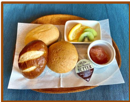
・スィスブレッド 700円 (自家製りんごジャム付)

*スィスブレッド、レアチーズケーキはお飲み物と一緒に注文すると セットで100円引きになります。