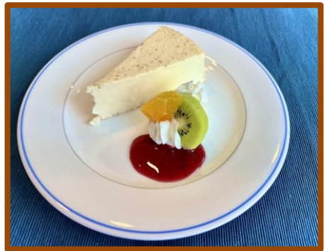
・レアチーズケーキ 650円