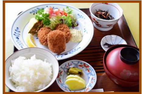
カニクリームコロッケ定食